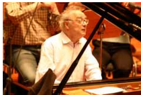
Alfred Brendel bei der Probe heute Vormittag (19.11.)

Ein Großer nimmt jetzt seinen Abschied von der Konzertbühne: Alfred Brendel, Jahrgang 1931. Den Orchestern, mit denen er bis Mitte Dezember noch auftritt, gereicht das zur Ehre: Berliner Philharmoniker, Wiener Philharmoniker, SWR Sinfonieorchester.