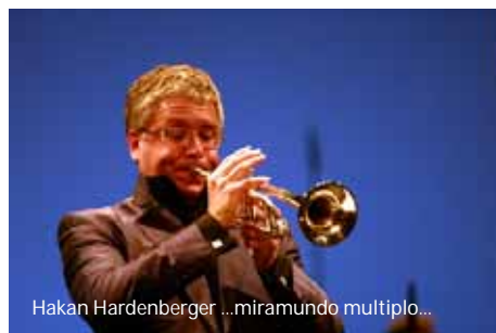
Hakan Hardenberger ...miramondo multiplo...

Starke Eindrücke hinterließ das Orchester auch in Paris. Beim Festival d'Automne dirigierte Kazushi Ono Prokofjews oft unterschätzte sechste Sinfonie und Musik der Gegenwart, darunter Olga Neuwirths „...miramondo multiplo...“ mit Hakan Hardenberger als Solist.