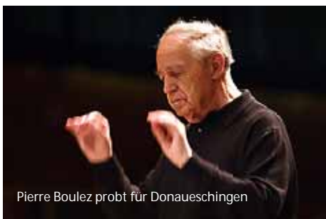
Pierre Boulez probt für Donaueschingen

Was vor gut 40 Jahren zum Fiasko geriet, wurde jetzt ein Triumph. Nach einer missglückten Uraufführung war damals das „Quintet for Groups“ des Amerikaners Ben Johnston in der Versenkung verschwunden. Sylvain Cambreling und das SWR Sinfonieorchester ließen die Partitur jetzt bei den Donaueschinger Musiktagen auferstehen. „Ein Meisterwerk“, stellte die Neue Züricher Zeitung fest, „muster-gültig vorgestellt und unglaublich bejubelt.“ Begeistert waren neben Publikum und Kritik auch die Musiker selbst: Sie sprachen Johnstons Werk den Kompositionspreis des Orchesters zu.